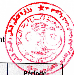
Tableau des établissements d'enseignement supérieur à couvrir par le Centre de Développement des Energies Renouvelables-CDER