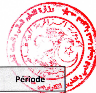
Tableau des établissements d'enseignement supérieur à couvrir par le Centre de Développement des Technologies Avancées-CDTA