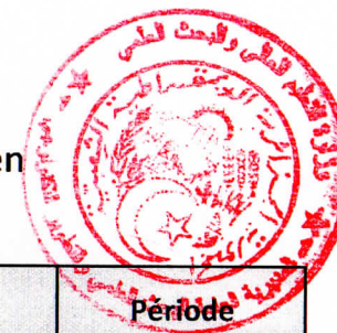
Tableau des établissements d'enseignement supérieur à couvrir par le Centre de Recherche en Biotechnologie -CRBT