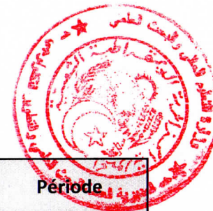
Tableau des établissements d'enseignement supérieur à couvrir par le Centre de Recherche en Technologies Industrielles -CRTI