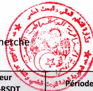
Tableau des établissements d'enseignement supérieur à couvrir par le Centre de Recherche Scientifique et Technique en Analyses Physico – Chimiques -CRAPC