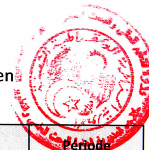
Tableau des établissements d'enseignement supérieur à couvrir par le Centre de Recherche en Technologie des Semi-conducteurs pour l'Energétique -CRTSE